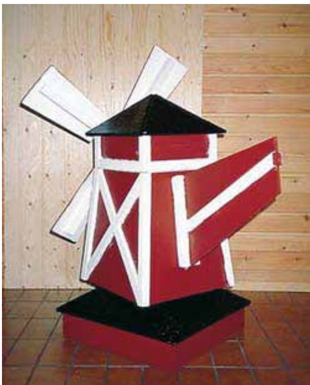
Nelikulmainen Bertta tuulimylly